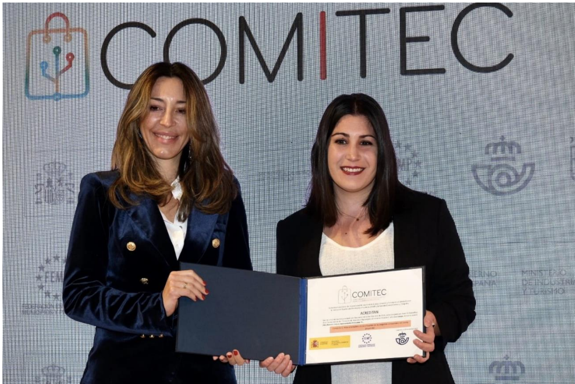
Foto 3 - Lliurament del diploma per part de Xiana Méndez, Secretaria d'Estat de Comerç del Ministeri d'Indústria, Comerç i Turisme

La xarxa d'establiments que podeu trobar a l'app creix gràcies als acords de col·laboració amb Gràcia Comerç i els 21 eixos comercials de Barcelona Oberta . Des del seu llançament, Loyapp compta amb més de 1.000 persones usuàries actives que han fet més de 3.000 validacions de punts a través de l'app, amb una taxa de repetició superior al 60%.